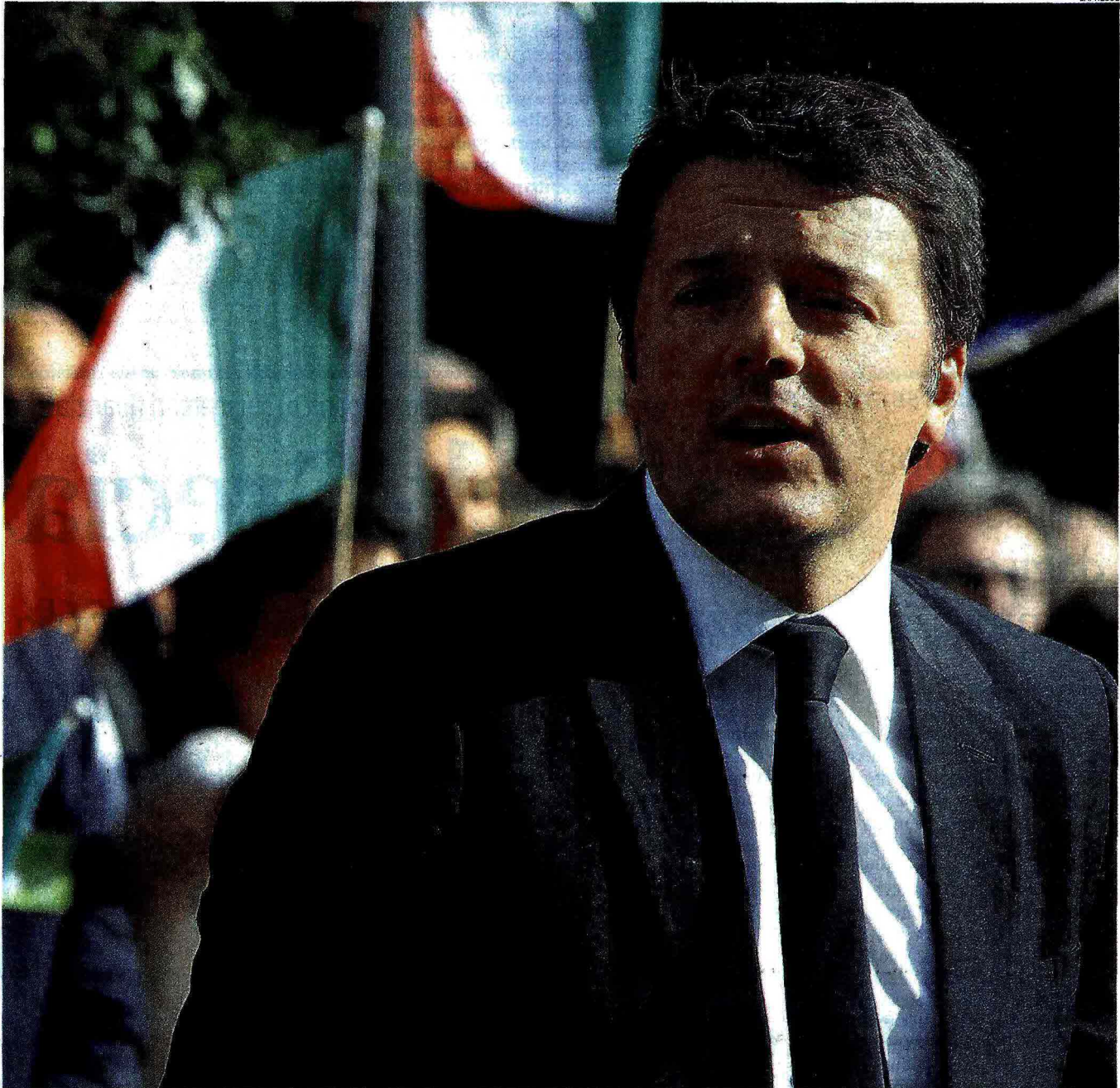
Il presidente del Consiglio. Matteo Renzi